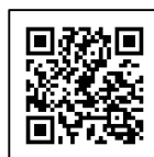
伸芽ねっと QRコード

HP ( www.shingakai.co.jp ) 「伸芽ねっと」よりお申し込みください。